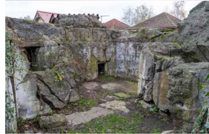
Bunker B1/5a in Santok

Besuchen Sie Santok und erfahren Sie die Geschichte am Ort des Geschehens – als Teil einer Route, die uns daran erinnert, wie kostbar Frieden und Freiheit in Europa sind.