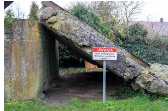
Bunker B1/1a in Santok