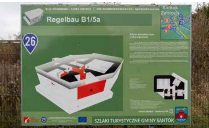
Schron Regelbau B1/5a – tablica informacyjna

Miejsce, gdzie dziś rzeka Noteć wpada do Warty, w styczniu 1945 r. znajdowało się w centrum wydarzeń światowej historii. Resztki umocnień w Santoku są nie tylko pozostałościami wojskowymi, ale także przestrogą dla przyszłych pokoleń, przypominającą o końcu II wojny światowej i głębokich przemianach w Europie.